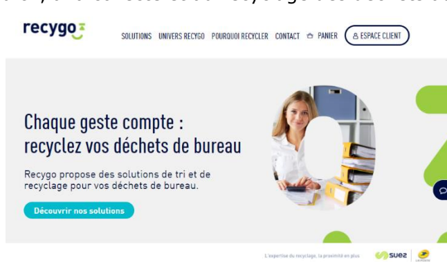
Page d'accueil du site recygo.fr

Pour rendre accessible et simple la démarche pour les clients, recygo.fr est ainsi le premier site de vente en ligne d'offres destinées au tri, à la collecte et au recyclage des déchets au bureau. Après avoir choisi l'offre adaptée dans la gamme de solutions, il suffit de renseigner ses coordonnées bancaires et de valider son devis directement par signature électronique. En moins de 6 jours ouvrés, le bureau abonné reçoit des contenants de tri : les employés peuvent commencer à trier. Les bureaux peuvent également accéder à des opérations de déstockage d'archives.